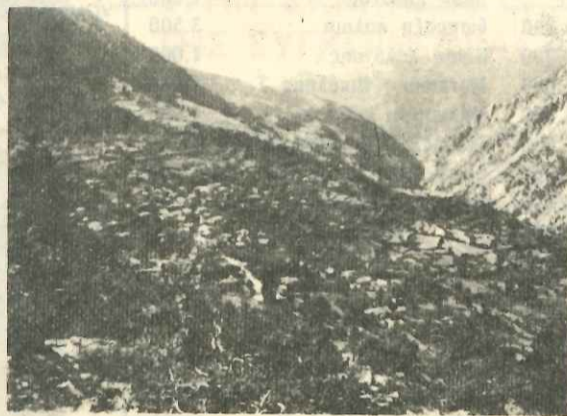
Πανοραμική άποψη του χωριού Νεραΐδα - Δολόπων